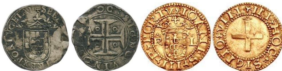
Moneda portuguesa: Tostao , Sebastián I (1557-1578) y Cruzado , Juan III (1521-1557) 48