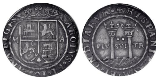
Real de a dos 45