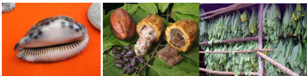
Concha de caurí 12 . Frutos y grano del cacao 13 . Hojas de tabaco 14 .

Al igual que en otros lugares y épocas, en las islas Canarias antes de la implantación de la circulación monetaria se contaba con otros elementos que cumplían la función de medio de pago. Estos elementos premonetales son muy variados dependiendo de cada zona: desde el uso de diversos metales con formas variadas en la zona africana, a diferentes tipos de conchas, sobre todo la llamada Cypraea Moneta , más conocida como caurí o cawrí 10 , cuyo valor era conocido y aceptado desde el Extremo Oriente hasta Papuasía, el Golfo de Guinea, el Mediterráneo y América. En el caso de Japón se usaron porcelanas chinas, espejos, brazaletes y perlas. También se conoce el uso de objetos premonetales como el cacao o el maíz en el México precolombino o la coca en Perú, objetos que siguieron usándose incluso después del contacto y conquista por parte de los españoles para el intercambio de productos. Así, en Brasil, a principios del siglo XVIII, cuando ya se acuñaba moneda, aún se autorizaba la circulación monetaria del cacao, junto con el azúcar y el tabaco 11 . Este caso también se da en el Archipiélago Canario, producido en parte, por la escasez del circulante.