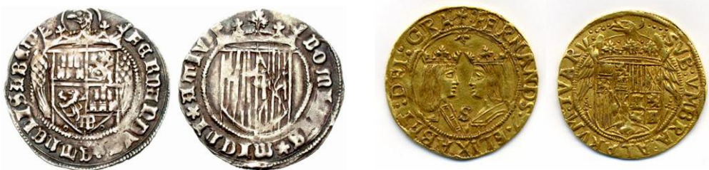
Real de los Reyes Católicos. Dos excelentes a nombre de los Reyes Católicos 30

En el caso del oro, los Reyes Católicos, acuñaron el castellano con su doble, al que llamaron excelente, con 23 \frac{3}{4} quilates y una talla de 25 en marco. Para la plata, todas las monedas iban a tener una Ley de 12 dineros y 4 granos y una talla de 67 piezas por marco. La moneda de plata más notable fue el real, que en su múltiplo llamado real de a ocho (que con el tiempo se llamaría dólar español o piastra) alcanzó el prestigio de moneda acreditada, sin variación en sus tipos, leyendas, peso y ley hasta 1566, año en el que Felipe II los cambió 29 .