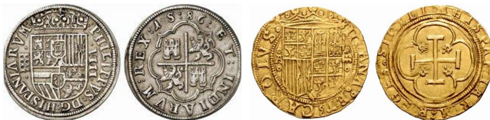
Real de a ocho de Felipe II 36 . Escudo de Carlos y Juana 37 .

La reforma de Carlos I no fue suficiente para resolver los problemas financieros provocados tanto por su política exterior como por la acusada fuga de moneda de plata y oro fuera del Imperio. Felipe II heredaría estos problemas, y sin embargo la reforma monetaria no llegará hasta el año 1566, diez años después de empezar su reinado. Esta reforma (Pragmáticas de Nueva Estampa) afectó a las monedas de oro, plata y vellón castellananas consistiendo en el cambio tipológico, desaparecía el retrato de las improntas monetarias y se priorizaba la representación heráldica 35 .