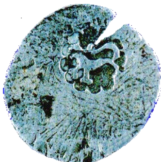
Resello bamba 58

Aunque conocemos pocas de las operaciones de resellado, una de las más notables son unas monedas de Indias de muy baja calidad que llegaron en barriles a las isla de Tenerife en el año 1559 56 . Estas monedas procedían de Santo Domingo, donde habían sido acuñadas. Su baja calidad hacía que no fuesen admitidas en ninguna isla, por lo que por medio de una Real Cédula se mandaron resellar con un signo a modo de palma (isla de La Palma) para que pudiese circular. Otro de los casos de resellado más conocidos es el de la moneda llamada “bamba” o “provincial”, que circuló en gran cantidad por las islas durante casi trescientos años. Se trataba de reales de plata fabricados por los Reyes Católicos y bajo los reinados de Juana y Carlos V, estos últimos fueron los más abundantes. Generalmente son monedas de medio y un real aunque existen casos de reales de a 2, estando en la mayoría de los casos recortadas. El resello se aplicaba en el reverso, y el signo correspondía a un león pasante de tres patas; dos delanteras y una trasera, normalmente la izquierda, todo dentro de una orla o roseta lobulada. Los tipos más comunes de esta moneda fueron tres: yugo y flechas, también llamada “manojillos”, el tipo de columnas, llamada pilares y los del tipo cruz 57 .