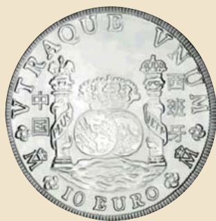
Año de España en China - 2007 10 Euros - Ag 925 mls.- Ø 40 mm - 27 grs.

La difusión del real de a ocho o peso duro fue tan importante que las transacciones mercantiles con otros países se hacían en esta moneda, que incluso durante el siglo XIX era internacionalmente aceptada por su valor intrínseco, y reconocida por su apariencia formal. Su área de circulación era tan extensa como fiable su calidad y prestigio de moneda acreditada llegando, incluso, a respaldar las emisiones de los primeros billetes americanos, en los que se hacía mención expresa del valor en “dólares españoles” o spanish milled dollars .