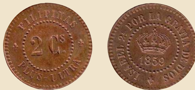
PRUEBA – 2 Céntimos – AE – Filipinas – 1859

La Casa de la Moneda de Filipinas emitió plata y oro, usándose para ello cuños que fueron enviados desde la Casa de Moneda de Madrid, las primeras monedas que salieron de sus máquinas, fueron de 1864 a 1868, 10 y 20 Cs. de Pº, ya que el PESO era la unidad monetaria. Al año siguiente se emitieron 50 Cs. de Peso igualmente hasta 1868. Los 4, 2 y 1 Peso en oro, se emitieron desde 1861 a 1868. Solo hubo una emisión en cobre y fue en 1835 de piezas de 4 – 2 – 1 Quarto, son algo toscas, con apariencia de haber sido obtenidas mediante fundición y en ellas aparece en su anverso león coronado portando espada y en su reverso escudo real coronado, con escusón con tres flores de lis.