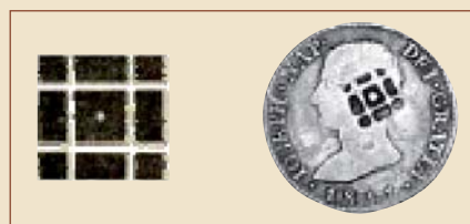
La figura de los punzones es un pequeño cuadrado de hierro de dos líneas de lado. Punzón de rejilla Resello sobre 4 Reales 1811

Durante el siglo XVIII, y especialmente bajo el emperador Qianlong (1736-1795), se produce la mayor afluencia de moneda de plata. Todas estas monedas, una vez reselladas, circularon en China en grandes cantidades. Los resellos chinos, llamados también chops , son especialmente variados y de muy diversos significados, llegando a ser compleja su interpretación. Una moneda puede presentar desde uno solo hasta numerosos resellos que imprimían comerciantes, cambistas y banqueros para autorizar su circulación en la zona, habilitarla para las transacciones comerciales con otros países, atestiguar la pureza del metal, o para operaciones contables. En otros casos esa contramarca permitía distinguir la moneda auténtica de la falsa, muy difundida en todo el comercio con Oriente.