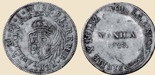
Podemos observar los resellos para las nuevas monedas, pero en este caso en particular la pieza originaria fue emitida de 1828 en Perú y ese mismo año contramarca en Manila

En 1728 se tiene conocimiento de que en Filipinas eran usadas unas piezas de 23 m/m de diámetro, que recibían el nombre de “BARILLA”, pese a las peticiones realizadas por el Capitán General de la falta de moneda fraccionaria, en tiempos de Carlos III, se habilitó a los comerciantes chinos la fabricación de Ochavos y uno, dos y cuatro Quartos.