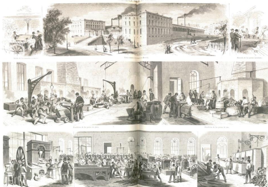
Lámina de La Ilustración Española y Americana 124

La falsificación está íntimamente relacionada con el proceso de fabricación de la moneda en España y las distintas innovaciones aportadas a lo largo del tiempo para acabar con ella. Podemos observar el proceso que se utilizaba para la acuñación en el siglo XIX en publicaciones de la época como La Ilustración Española y Americana donde se detalla el trabajo en la Nueva Fábrica de la Moneda de Madrid 123 . (Ver Anexo I.3)