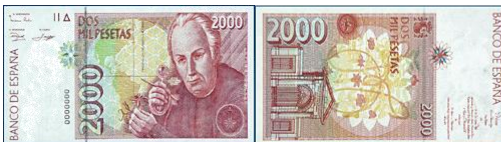
Marcas de seguridad en el billete de 2000 pesetas, emisión de 1992 213 .