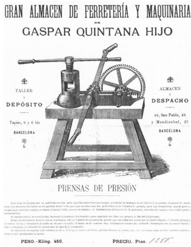
Imagen de una prensa de venta al público destinada a la acuñación 157 .

“Estas máquinas son un poderoso auxiliar para aquellas industrias que tengan necesidad de trabajos de acuñación y no puedan disponer de mucho local, o la situación del taller no les permita hacer mucho ruido, aunque se instalen en habitaciones del centro de la población, cercadas de vecinos, cuyo ruido pudiera incomodarles. Su manipulación es sencillísima, bastando solamente dos hombres para imprimir con ellas una presión de 400.000 kg [...] El banco es de madera, muy sólidamente construido; pudiendo desarmarse con la mayor facilidad toda la maquina en infinidad de piezas para su más fácil transporte.” 158