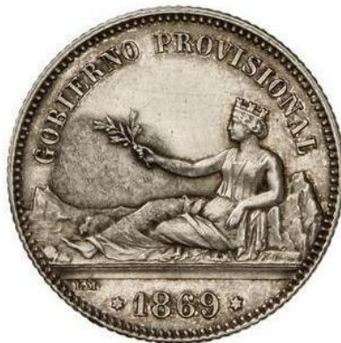
Anverso con la leyenda de la que hemos hablado 35 .

La nueva moneda ofrecía como signos de garantía la indicación de la pureza del metal y el peso, con ello se pretendía conseguir: la difusión del sistema decimal, la credibilidad del usuario y la posibilidad de comprobación del valor de la moneda que garantiza el poder emisor 33 . La primera remesa de pesetas en plata, antes de fijarse los tipos, tuvo una fuerte intención propagandística, su valor es más conmemorativo que económico, e incluía en la leyenda del anverso “GOBIERNO PROVISIONAL” en lugar de “ESPAÑA”. También cabe la posibilidad de que fuera un error provocado por lo rápido que se desarrollaron estos acontecimientos. Utilizará los tipos diseñados por Luis Marchionni para la medalla conmemorativa de la subida al poder del Gobierno Provisional; finalmente serán las improntas que perduren en la moneda, con el cambio pertinente de leyenda 34 .