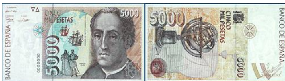
Marcas de seguridad en el billete de 5000 pesetas, emisión de 1992 214 .