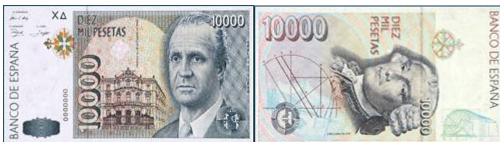
Marcas de seguridad en el billete de 10000 pesetas, emisión de 1992 215 .