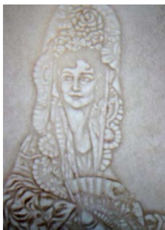
Marca de agua del billete dedicado a Romero de Torres 200 .

El primer pliego de papel de seguridad fue fabricado en octubre de 1953 por la Fábrica Nacional de Moneda y Timbre. Tenía una marca de agua sombreada destinada para un billete encargado por el Banco de España. Era la cabeza de una mujer de una de las pinturas de Julio Romero de Torres, una filigrana destinada a formar parte del billete de 100 pesetas que se iba a dedicar al pintor andaluz 199 .