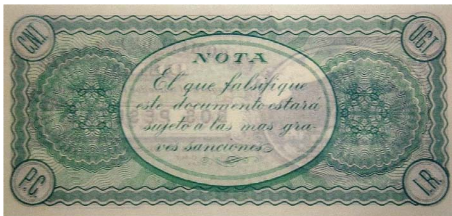
Emisión de 26 de septiembre de 1936. Advertencia contra la falsificación 195 .

Un elemento que se puede resaltar en los billetes de este periodo, incorporado en determinados momentos, fue la inclusión de pequeños fragmentos sobre las penas recogidas sobre falsificación en el Código Penal. Por ejemplo la advertencia, “LA FALSIFICACIÓN DE ESTE BILLETE SERÁ SANCIONADA CON EL MÁXIMO RIGOR”, imprimida durante la Guerra Civil en algunos billetes del bando franquista 193 , o la emisión municipal de Denia del 26 de septiembre de 1936 de billetes de 2 pesetas, donde aparecía dentro de un espacio circular el texto: “NOTA. El que falsifique este documento estará sujeto a las más graves sanciones” 194 .