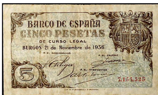
Billete de la Litografía Portabella, Zaragoza, primera emisión del Gobierno de Burgos 75 .