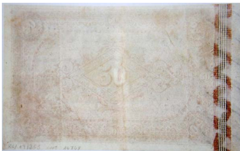
Imagen de billete con tarlatana 190 .

La adopción de una nueva medida de seguridad, realizada por el Banco de España y utilizada por primera vez en la serie de enero de 1878, fue la incorporación de la tarlatana. Se trataba de una pequeña tira de gasa alojada en la pasta, fabricada por la Papelería Oseñalde de Guadalajara.