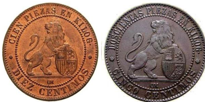
Reverso de una “perra gorda” (izda.) y una “perra chica” (dcha.) de 1870 en las que se observa la marca «OM» de la casa Oeschger, Mesdach & Cía 39 .

mayoría del metal procede de las piezas retiradas (instrucción de 29 de mayo de 1870), y las obras de fundición, laminado, etc., se realizan en Francia en Bianche Saint-Vaast, un taller contratado, mientras que la fabricación de troqueles y virolas se realiza en Barcelona 37 . Todas estas piezas llevaban la fecha de 1870 aunque se fabricaron hasta 1876. El período de circulación fue aún mayor, pues no se consiguió la retirada de las denominadas “perras gordas” (10 céntimos) y las “perras chicas” (5 céntimos) hasta 1941 38 .