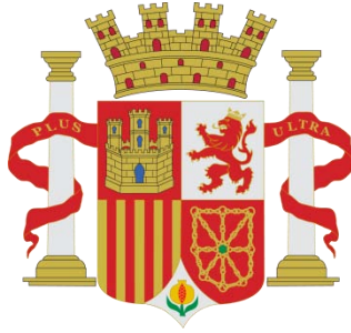
Escudo definitivo para estas primeras emisiones de la Peseta 32 .

La nueva moneda ofrecía como signos de garantía la indicación de la pureza del metal y el peso, con ello se pretendía conseguir: la difusión del sistema decimal, la credibilidad del usuario y la posibilidad de comprobación del valor de la moneda que garantiza el poder emisor 33 . La primera remesa de pesetas en plata, antes de fijarse los tipos, tuvo una fuerte intención propagandística, su valor es más conmemorativo que económico, e incluía en la leyenda del anverso “GOBIERNO PROVISIONAL” en lugar de “ESPAÑA”. También cabe la posibilidad de que fuera un error provocado por lo rápido que se desarrollaron estos acontecimientos. Utilizará los tipos diseñados por Luis Marchionni para la medalla conmemorativa de la subida al poder del Gobierno Provisional; finalmente serán las improntas que perduren en la moneda, con el cambio pertinente de leyenda 34 .