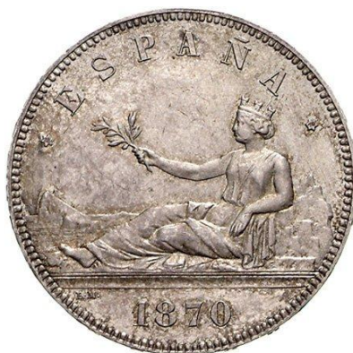
Anverso de las 5 pesetas de 1870 que muestra la tipología descrita 28 .

atributos propios de la Soberanía Nacional 26 . La Real Academia de la Historia decidió los elementos que serían usados para representar a la Nación. La imagen elegida fue una alegoría usada en época romana por el emperador Adriano, una matrona recostada en los Pirineos, rodeada del Océano, con los pies en el Estrecho de Gibraltar, la rama de olivo en la mano y la diadema en la cabeza 27 .