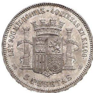
Ley de 900 milésimas en el reverso 5 pesetas de 1870 25 .

Se eligió la peseta para esta adaptación por ser la moneda ya existente más parecida al franco francés, con un peso teórico de 5,192gr., frente a los 5gr. que adoptó a partir de ese momento. Ésta se acuñaría en plata con múltiplos de 2 y 5 pesetas en el mismo metal y de 10, 20, 50 y 100 pesetas en oro; sus divisores fueron de 50 y 20 céntimos en material argénteo y 10, 5, 2 y 1 céntimos en bronce. La plata se fabricaba con una ley de 835 milésimas con excepción del valor de 5 pesetas, que tenía un fino de 900 milésimas. La indicación de la ley fue grabada en el reverso de la moneda con la intención de lograr la confianza de los usuarios. Estas medidas se realizaron siguiendo las directrices de la Unión, que establecía el valor intrínseco, inferior al nominal, con la finalidad de evitar que la moneda huyera del comercio interior. (Éstos y otros aspectos técnicos del Decreto de 19 de octubre de 1868 22 en Anexo I.2). Como vemos, el cambio era significativo y fue necesario un período de adaptación 23 . En opinión de otros autores la peseta, más que una creación, sería un sistema monetario derivado del proceso de implantación del liberalismo 24 .