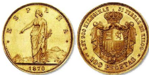
Pieza de 100 pesetas en oro 41 .

En cuanto al oro, sólo se conoce la pieza de 100 pesetas, cuyo peso se había rebajado con respecto al anterior en un 3,99%; fue una emisión que tuvo una mala acogida, tanto por el mercado como por el Banco de España, ya que el modelo que se seguía era el de la coincidencia de valor nominal y valor intrínseco 40 .