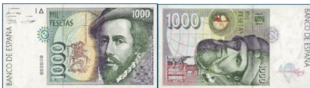
Marcas de seguridad en el billete de 1000 pesetas, emisión de 1992 212 .

Una vez se tiene el papel con sus elementos de seguridad se realiza la impresión de las viñetas, retratos, escudo, cifras y letras indicativas del valor, leyendas y firmas mediante la técnica de calcografía multicolor 209 . Gracias a ella se produce un dibujo difícil de reproducir, con luces y sombras, además de un tacto rugoso 210 . El acabado irisado y el continuo cambio de color de estos billetes son creados mediante fondos litográficos multicolores, además del elemento de coincidencia del anverso y reverso que cuando son observados a trasluz se ajustan 211 .