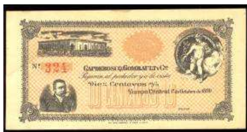
Vales emitidos a nombre de Capdeboscq, Gombault y Cia. Pampa Central. 1º de Octubre de 1899.