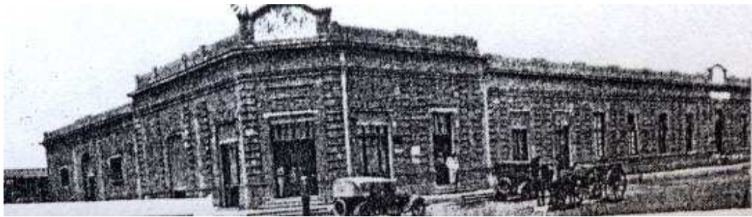
Imagen de "EL Pito" en una posterior a la que ilustráramos más arriba.